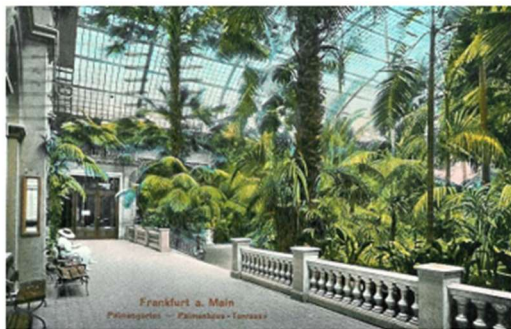
Frankfurt a. Main Palmengarten - Palmengarten - Terrassen Palmengarten Frankfurt, Palmenhaus