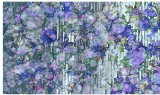
Kunstaussstellung im Senckenberg Naturmuseum Frankfurt